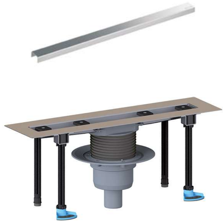
Душевой лоток HL50FV (HL50FV.0)